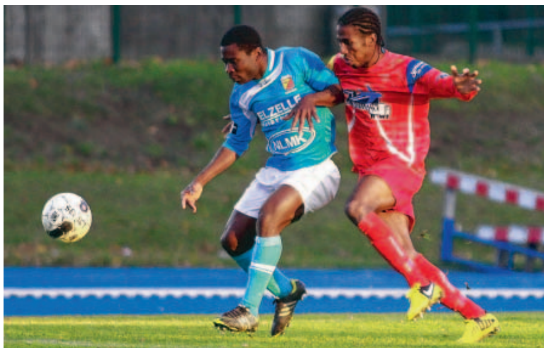
Contre le White Star, Tubize était parvenu à tenir les Étoilés à distance. Ça n'a pas toujours été le cas. ■ DEVAUX